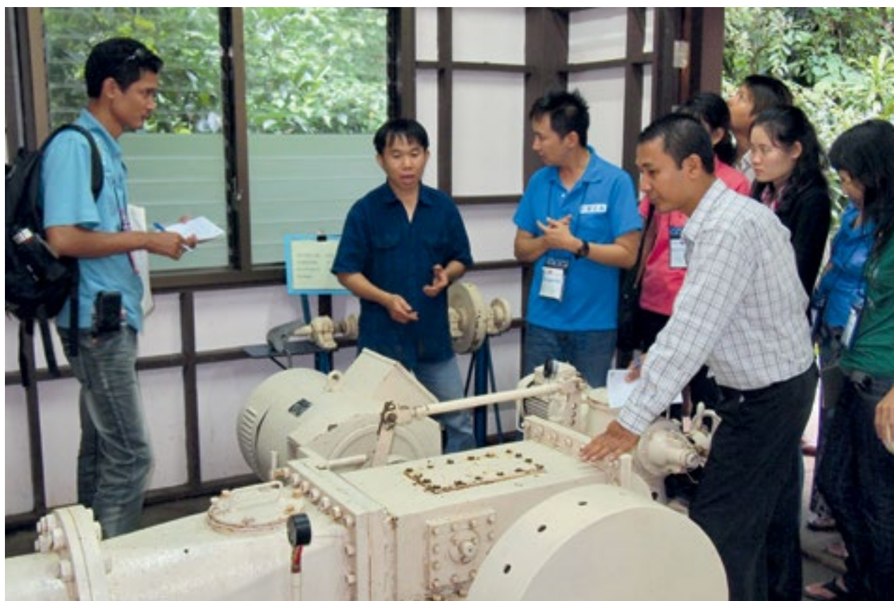
Entender una planta de energía hidroeléctrica: visitantes de Myanmar aprenden cómo funciona un fuente de energía renovable descentralizada en el pueblo de Mae Kam Pong, Tailandia.

En 1999, el líder de Mae Kam Pong, con ayuda de organizaciones externas, inició el programa de “Turismo Sostenible” en la comunidad. La población fue declarada aldea turística en el año 2000. Se ofrece a los visitantes la posibilidad de alojarse en casas de familias de la comunidad y disfrutar de la cultura, así como de las maravillosas sendas naturales existentes en la zona. Entre otras actividades, cabe destacar las excursiones a la plantación de café, que se cultiva de forma armoniosa junto a una cascada. La fabricación de almohadas de hojas de té complementa asimismo la producción. La producción de té y café, que se venden tanto en la propia aldea como en otras localidades, representan también otra fuente de in-