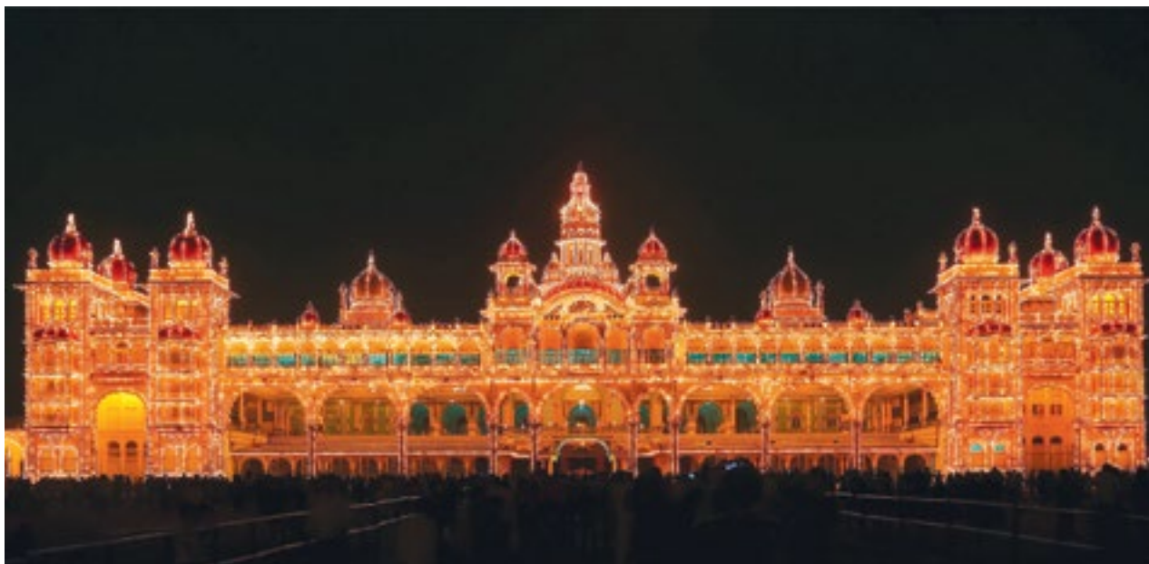
La iluminación del Palacio de Mysore y otros monumentos en la India consumen una gran cantidad de energía eléctrica, y eso en un país con un déficit de energía muy elevado.

numentos mediante la conversión de los focos a LED. Con ello se ha logrado garantizar una vida más duradera para estos emblemáticos monumentos, que se estaban viendo afectados por la intensa luz y el calor de los focos incandescentes. Asimismo se ha obtenido un enorme ahorro en la cuenta de la luz, contribuyendo así a una enorme reducción de las emisiones de gases de efecto invernadero gracias a un menor consumo de energía eléctrica.