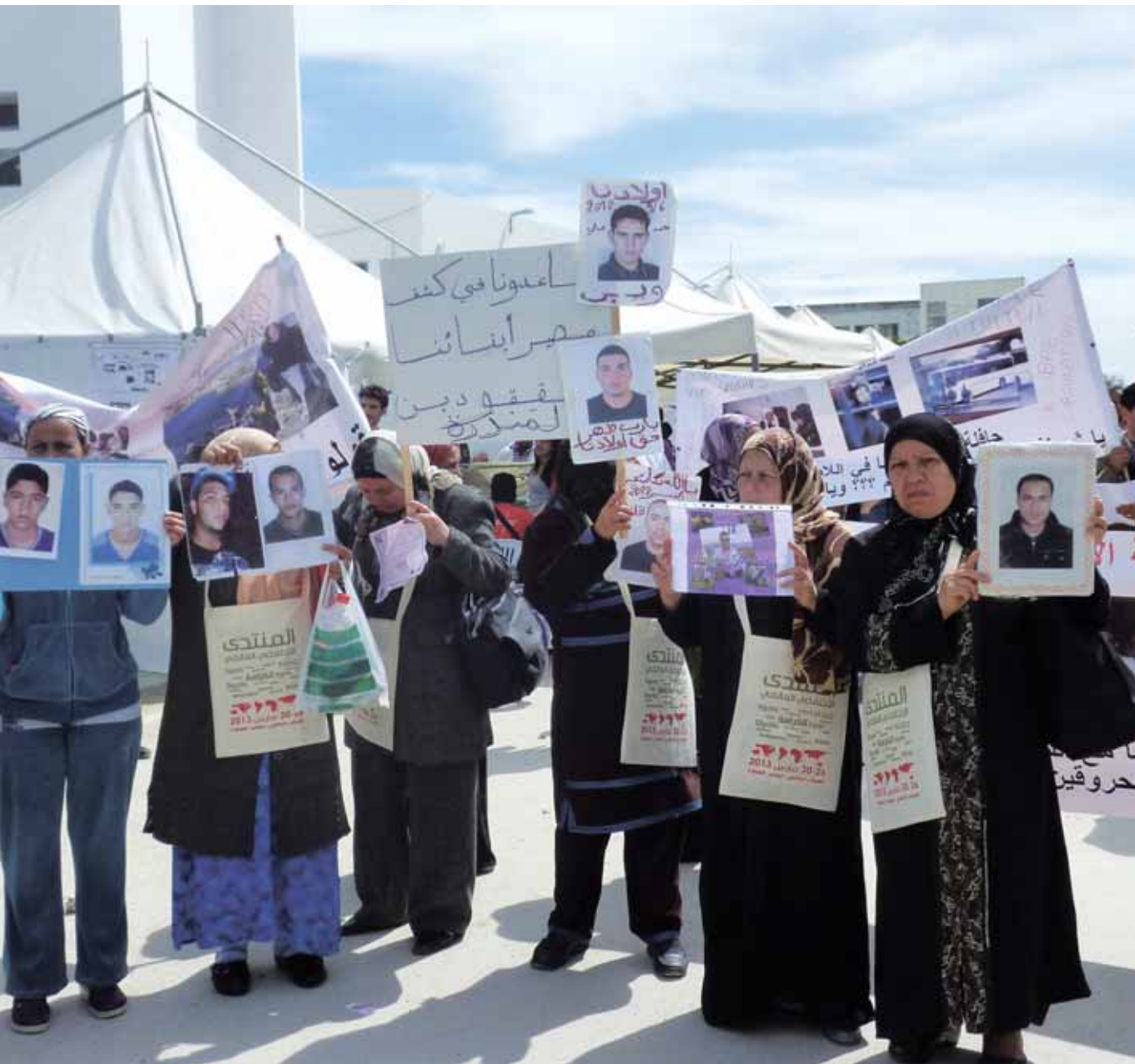
↑ PROTESTE DES MÈRES ET DES PROCHES DE MIGRANTS DISPARUS EN MER PENDANT LE FORUM SOCIAL MONDIAL À TUNIS.

des forces de sécurité ayant été perturbée. Pour les réfugiés et les migrants, l'occasion avait été bonne pour monter dans les bateaux, nombreux sont ceux ayant considéré la nouvelle liberté du joug du régime comme une liberté de circulation à l'instar de la chute du Mur de Berlin. L'Europe s'est donc hâtée de rétablir l'ordre dans le nouveau gouvernement tunisien en matière de contrôle des migrants. Un « partenariat pour la mobilité » a été promis à la Tunisie si les conditions européennes en matière de lutte contre la migration irrégulière étaient respectées. Le partenariat pour la mobilité aurait permis d'introduire de façon sélective et selon les