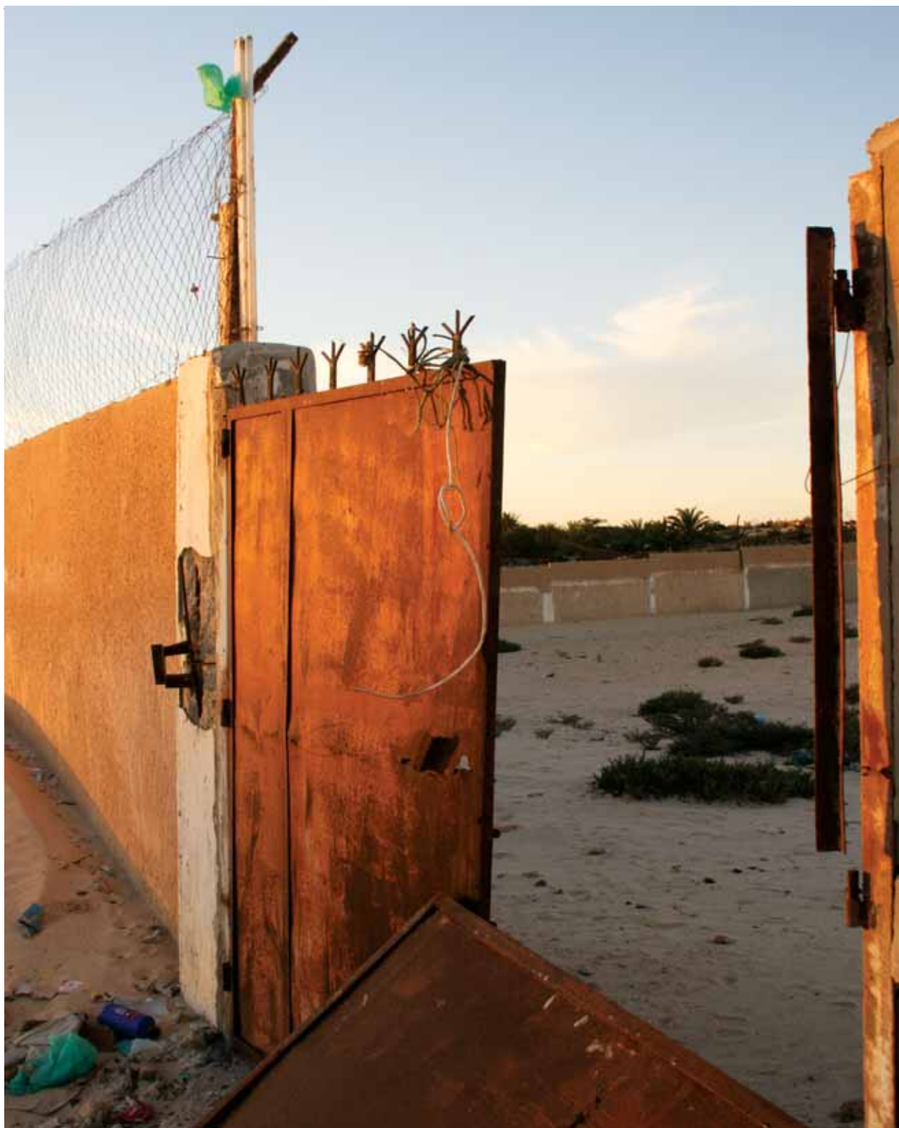
↑ LE CAMP DE DETENTION „GUANTANAMITO“ À NOUADHIBOU, UN LIEU ORPHELIN DE DÉPORTATION