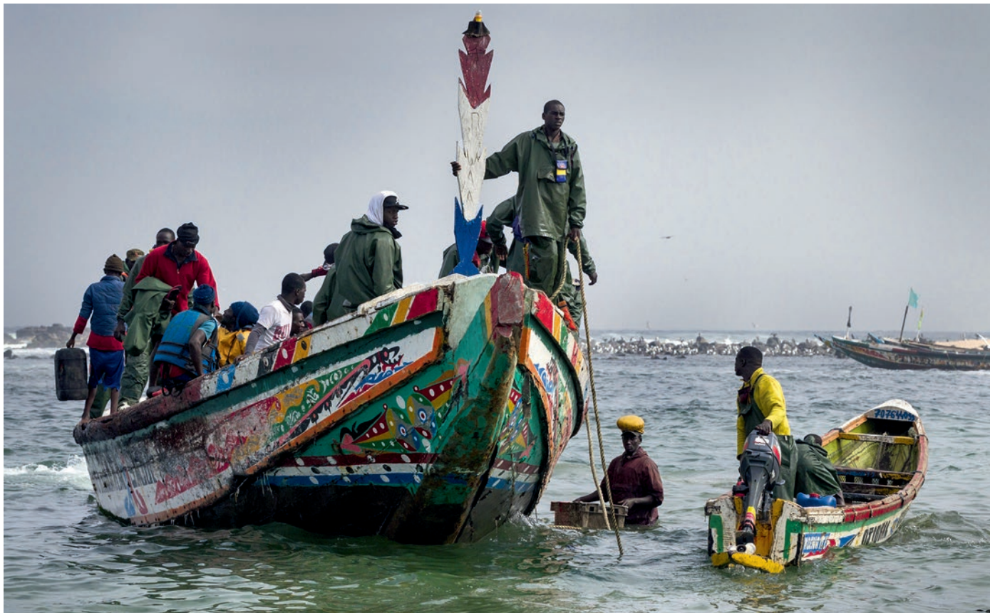
Fischer an der westafrikanischen Küste. Viele von ihnen können in ihrem Beruf kaum noch genug Einkommen für sich und ihre Familien erwirtschaften.

Herkunftsländern. Dabei sind die chronischen und akuten Notlagen, die Menschen zur Flucht zwingen, selten allein in lokalen Umständen begründet. Kriege werden zerstörerischer und brutaler, wenn sie zu Stellvertreterkriegen werden, in denen die EU und andere mächtige Akteure ihre eigenen Interessen verfolgen. Die von europäischer Politik mitverursachten Rahmenbedingungen zwingen Menschen zum Gehen und konterkarieren damit selbst die besten Entwicklungskonzepte. Die Bekämpfung von Fluchtursachen muss daher im globalen Norden, also auch in Europa, ansetzen. Die von der europäischen Politik mitverantworteten Gründe, die Menschen weltweit in die Flucht treiben, reichen zurück in den Kolonialismus und manifestieren sich in der Gegenwart in postkolonialen Strukturen. Nicht zuletzt ist es die klimaschädliche und auf Ressourcenausbeutung basierende Lebens-, Konsum- und Produktionsweise des globalen Nor-