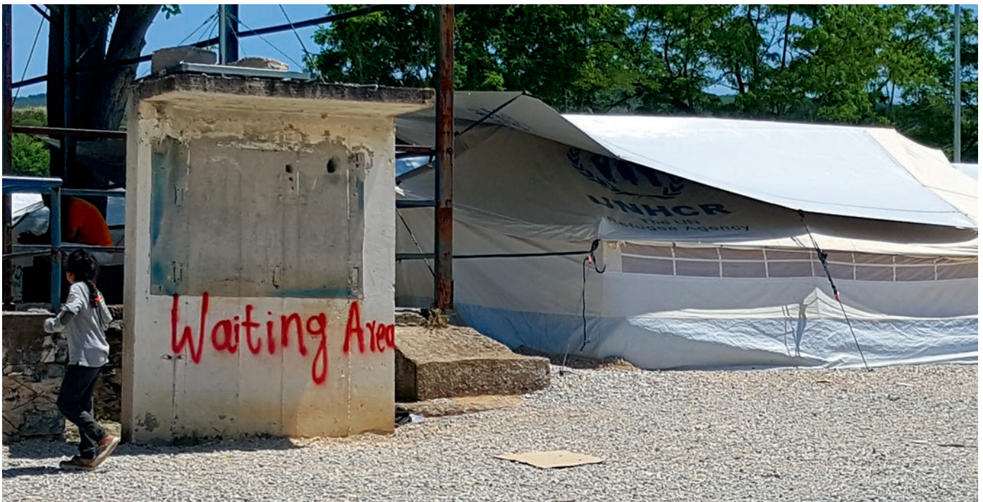
An den Rändern der EU entstehen immer mehr „Wartezonen“ für Menschen, denen die Weiterreise verweigert wird: Flüchtlingslager bei Lagkadikia in Nordgriechenland.

360 Tote vor der Küste von Lampedusa - das war 2013 noch eine Nachricht, die für Schlagzeilen sorgte. Italiens Präsident organisierte ein Staatsbe- gräbnis. Im Vorwort der 2014 gemeinsam von Brot für die Welt, medico international und PRO ASYL veröffentlichten Studie „Im Schatten der Zitadelle“ verweisen wir auf die Tragödie und fordern: „Das Sterben an den europäischen Außengrenzen muss aufhören.“