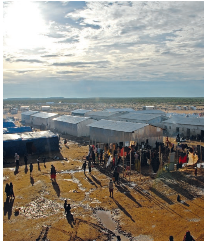
Über den EU-Treuhandfonds sollen regionale Schutz- und Entwicklungsprogramme (RPDP) entstehen. So auch in Dolo Ado in Äthiopien.

Wenn die Wirtschaft durch Investitionen wächst, entstehen Arbeitsplätze, hebt sich das Einkommensniveau der Gesellschaft und verbessern sich die allgemeinen Lebensbedingungen. Und damit werden Wunsch oder Notwendigkeit schwächer, das Land zu verlassen. So etwa funktioniert die simple Kausalkette, die neuen Entwicklungskonzepten für den afrikanischen Kontinent zugrunde liegt. Mit dem europäischen Investitionsplan, dem bundesdeutschen „Marshallplan mit Afrika“ und der vom Bundesfinanzministerium erarbeiteten G20-Initiative zur Förderung von privaten Investitionen und Investitionen in Infrastruktur‘ (kurz „Compact with Africa“) verschreibt sich die Bundesregierung drei großen Vorhaben, die Fluchtursachen vorbeugen und entgegenwirken sollen. Es ist vor allem die Privatwirtschaft – konkret die Unternehmen der G20 –, die die afrikanischen Märkte entwickeln und beleben soll. Dafür werden nun die makroökonomischen, wirtschafts-